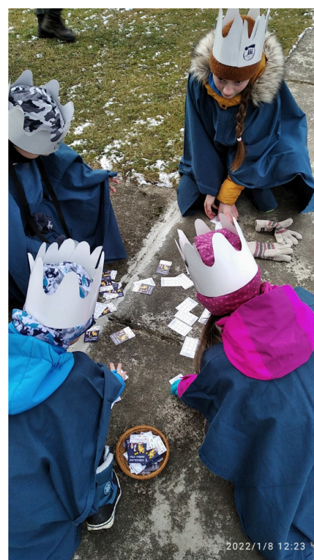
6. Když jste čtyři

Fotografie a popisky nám dodala Angelika Šalplachtová