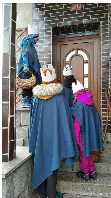
4. Když jsi malý