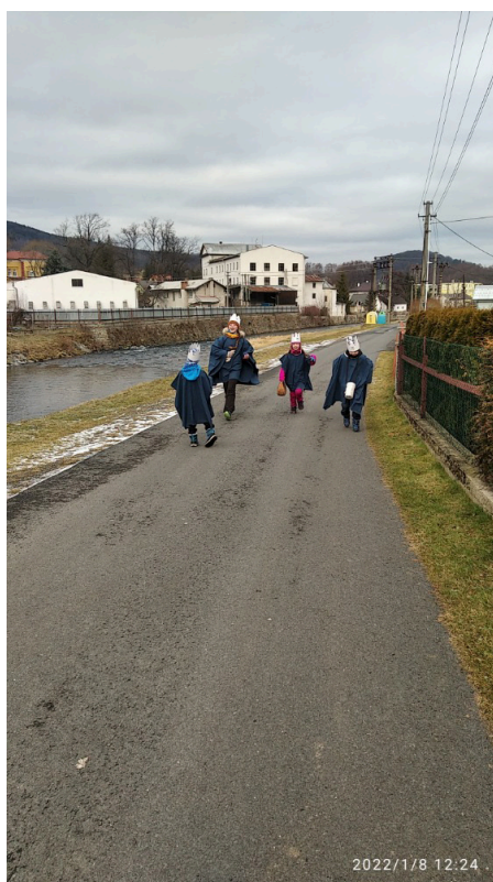
2. Když zakopneš