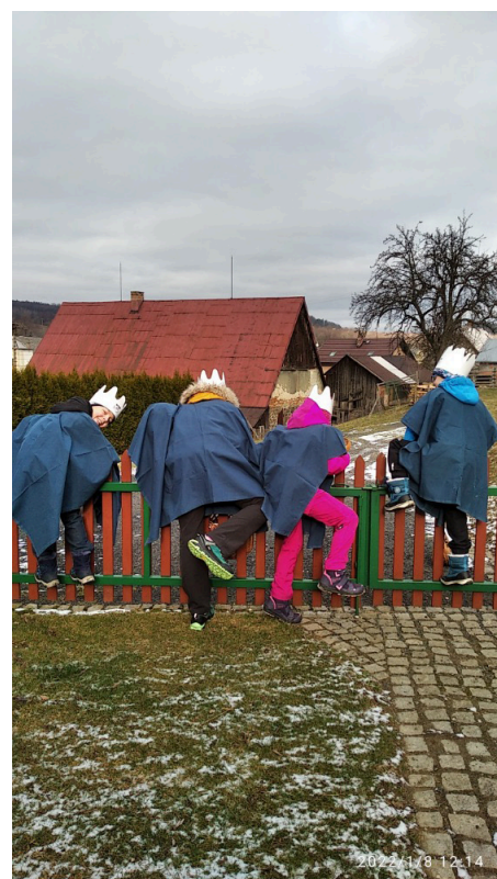
3. Když je tam pes