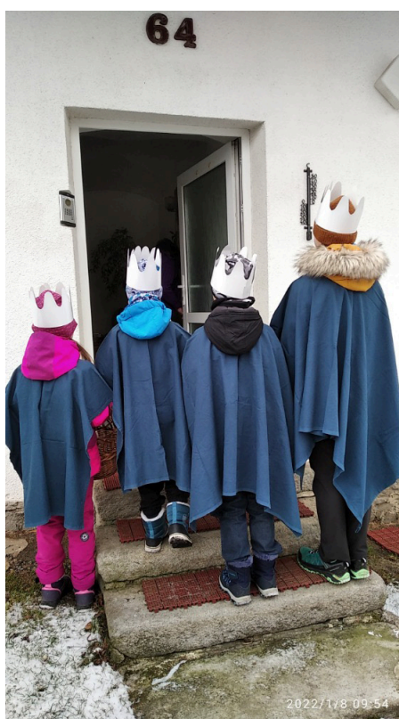
5. Když je ti zima