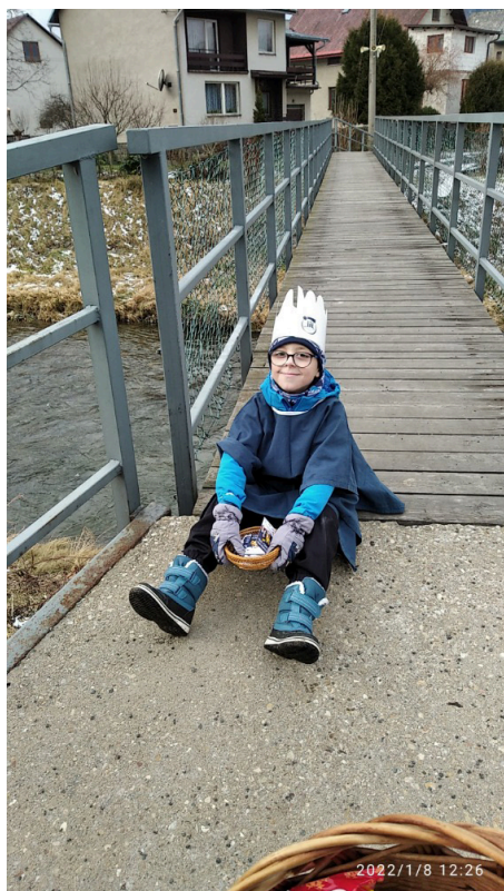
1. Když už nemůžeš