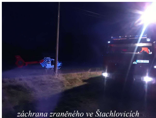
záchrana zraněného ve Štachlovicích