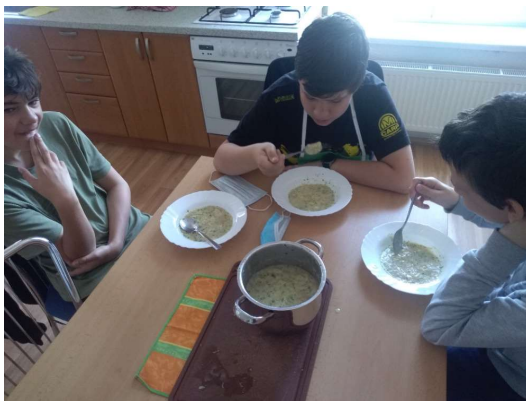
Foto z akce Chutě Jesenicka...