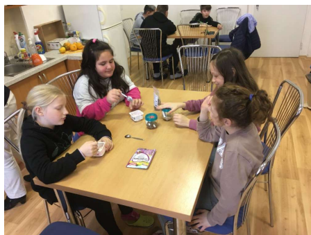
Foto z akce základní školy - Zdravá výživa