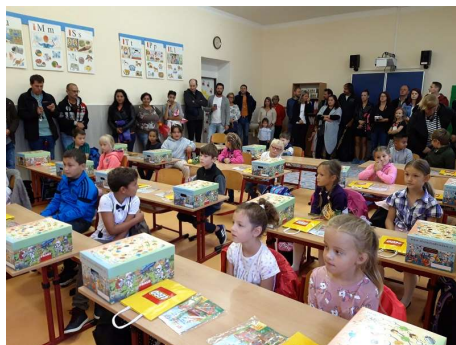
ZŠ - zahájení školního roku