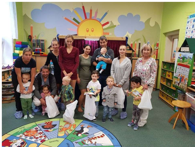
MŠ - zahájení nového školního roku

Individuálně se věnujeme všem dětem, ale i dětem s odloženou školní docházkou, ty navštěvují kroužek Učíme se hrou, tak abychom jim umožnili, co nejlepší start do života. V mateřské škole probíhá individuální preventivní logopedická péče pro děti s vadami řeči.